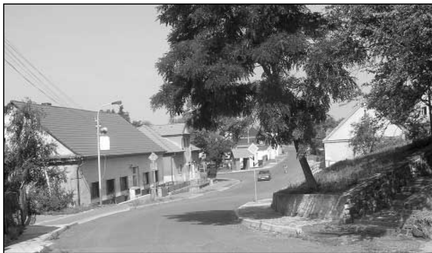
Tříděním odpadu přispějete k lepšímu vzhledu naší obce.